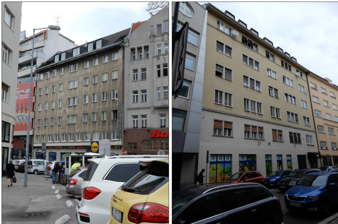
Uličná fasáda Dunajská a Grösslingova ulica

Mesto: Bratislava Mestská časť: Bratislava – Staré Mesto Adresa: Dunajská ul. č. 2, Grösslingova ul. č. 9 Adresa popisom: - Typ pamätihodnosti: nehnuteľná Názov pamätihodnosti: Obchodný dom TETA Číslo v zozname MČ: nie je evidovaná