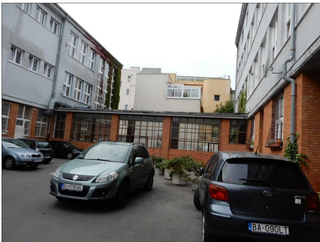
Spojovací křčok medzi dvoma budovami