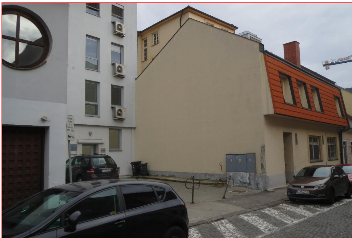
Pohľad na novostavbu s manzardou na mieste barokového domu.

Mesto: Bratislava Mestská časť: Bratislava- Staré Mesto Adresa: Jozefská ul. č.9 Adresa popisom: dom v radovej zástavbe na severnej strane ulice Typ pamätihodnosti: kategória 3 – zaniknutá Názov pamätihodnosti: pamätný dom Janka Matúšku Číslo v zozname MČ: Foto: