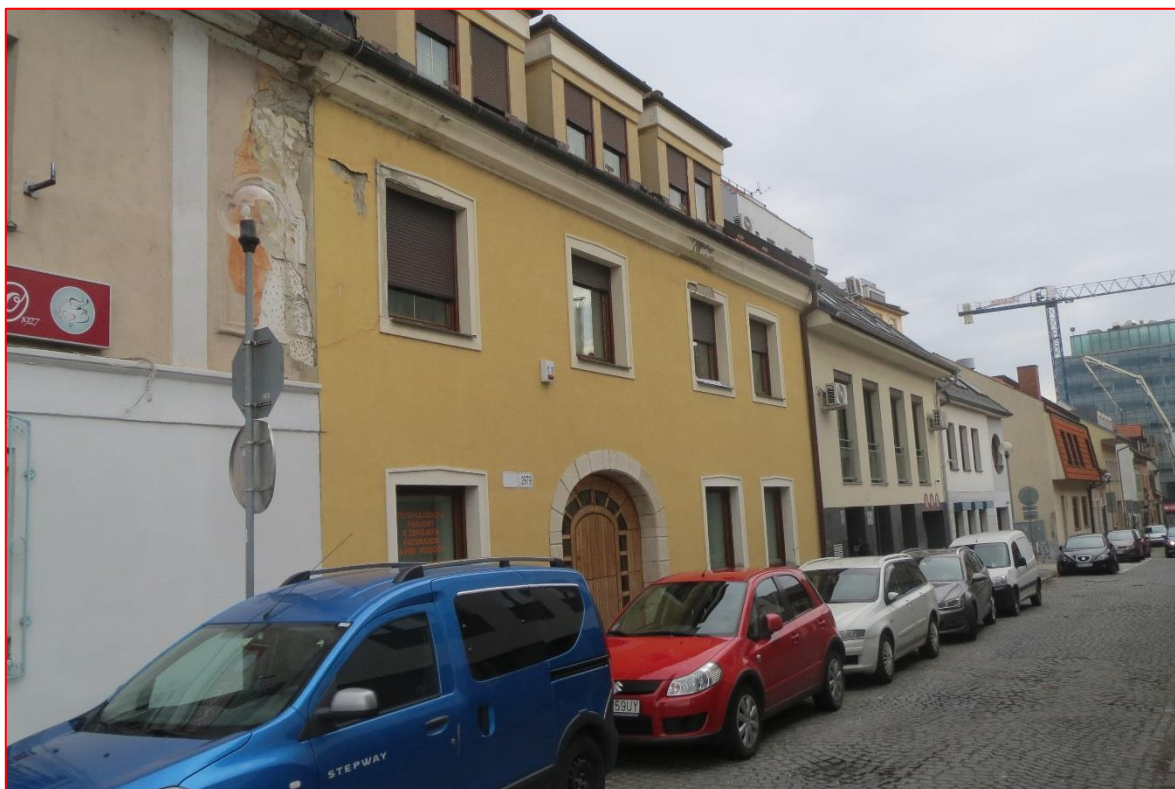
Pohľad na priečelie barokového domu (okrová fasáda).

Mesto: Bratislava Mestská časť: Bratislava- Staré Mesto Adresa: Jozefská ul. č.1 Adresa popisom: dom v radovej zástavbe na severnej strane ulice Typ pamätihodnosti: kategória 1A – hmotná nehnuteľná Názov pamätihodnosti: pamätný dom Juraja Palkoviča Číslo v zozname MČ: - Foto: