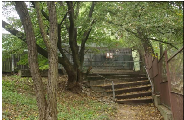
Pôvodné voliéry pre zvieratá z čias vzniku ZOO