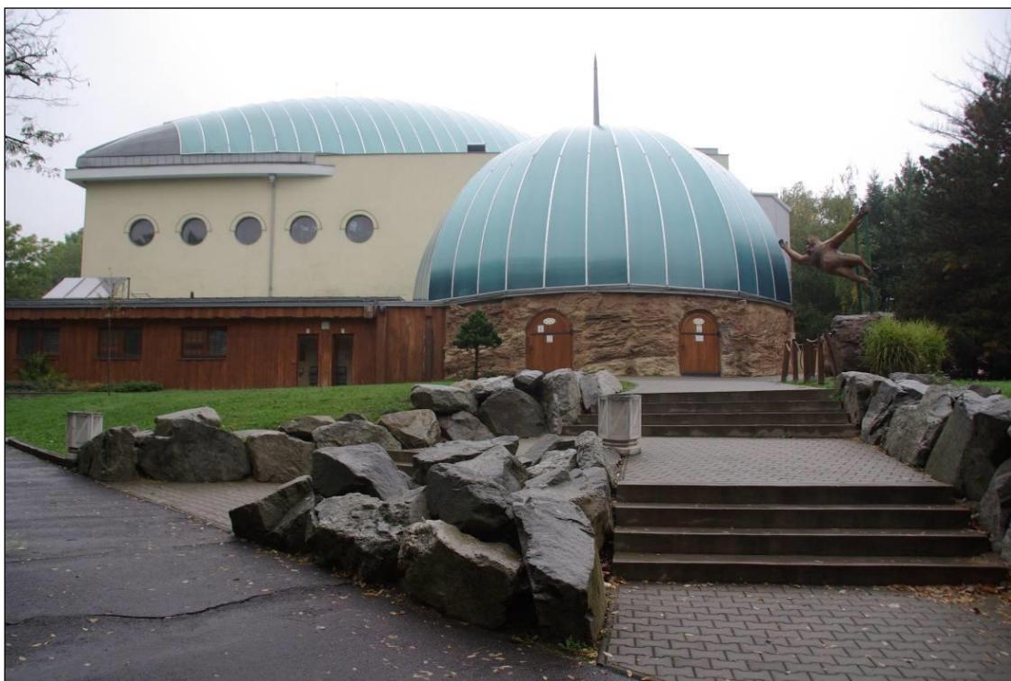
Nové stavby - Pavilón opíc z r.2014