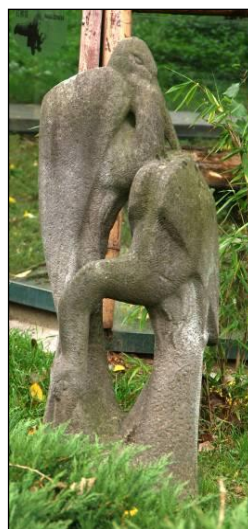
Pôvodné výtvarné dekoračné prvky ZOO