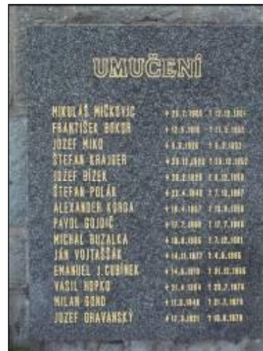
Pamätník obetí komunistického režimu na Cintoríne v Bratislave - Vrakuňa