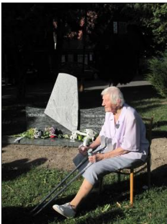
pamätníčka udalostí pri slávnostnom odhalení pomníka