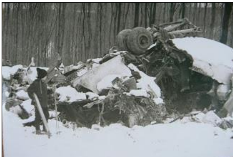
fotografia havarovaného Iljušina