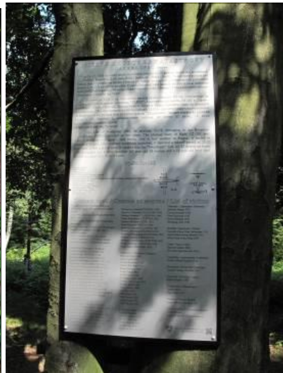
Kamenný kríž a pamätná tabuľa