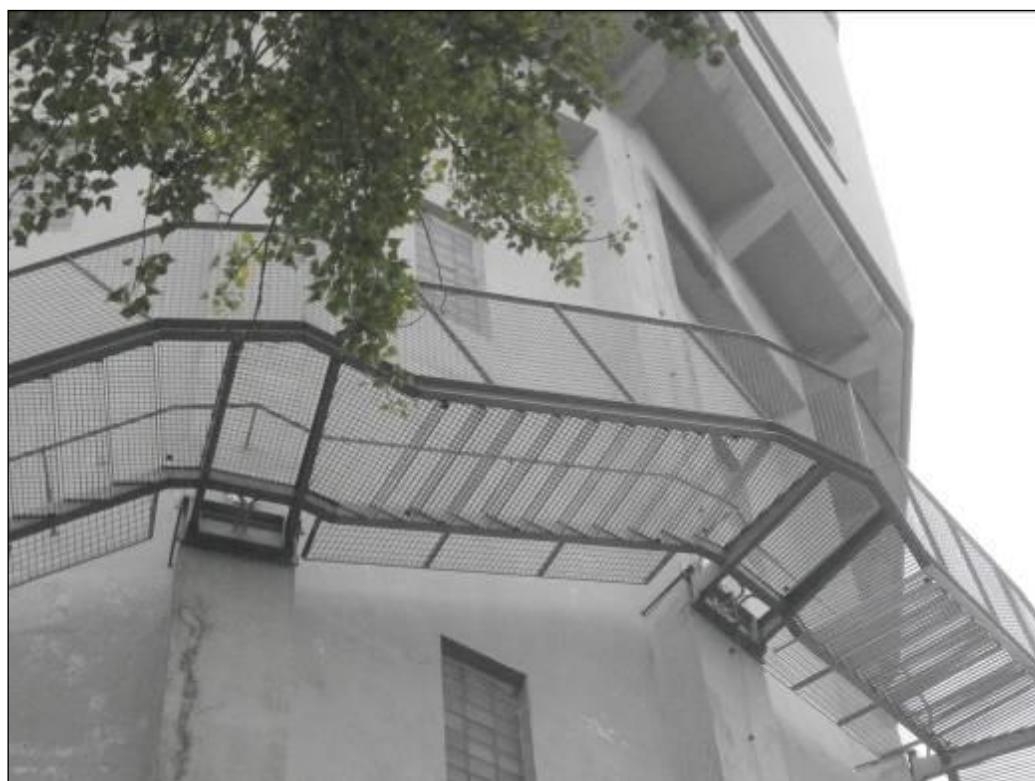
Detail nového schodiska na fasáde.