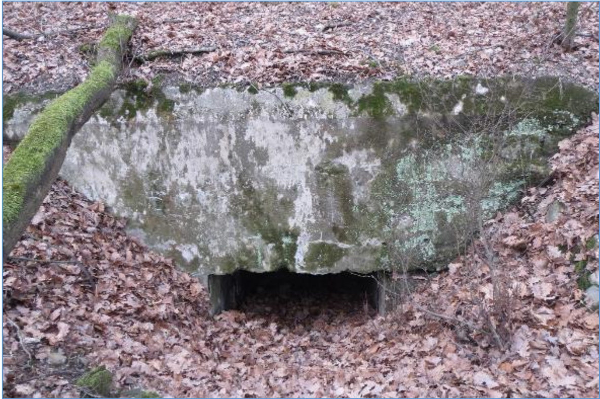
Detail vstup do zasypanej malej kaverny č.02 v lokalite Ahoj.