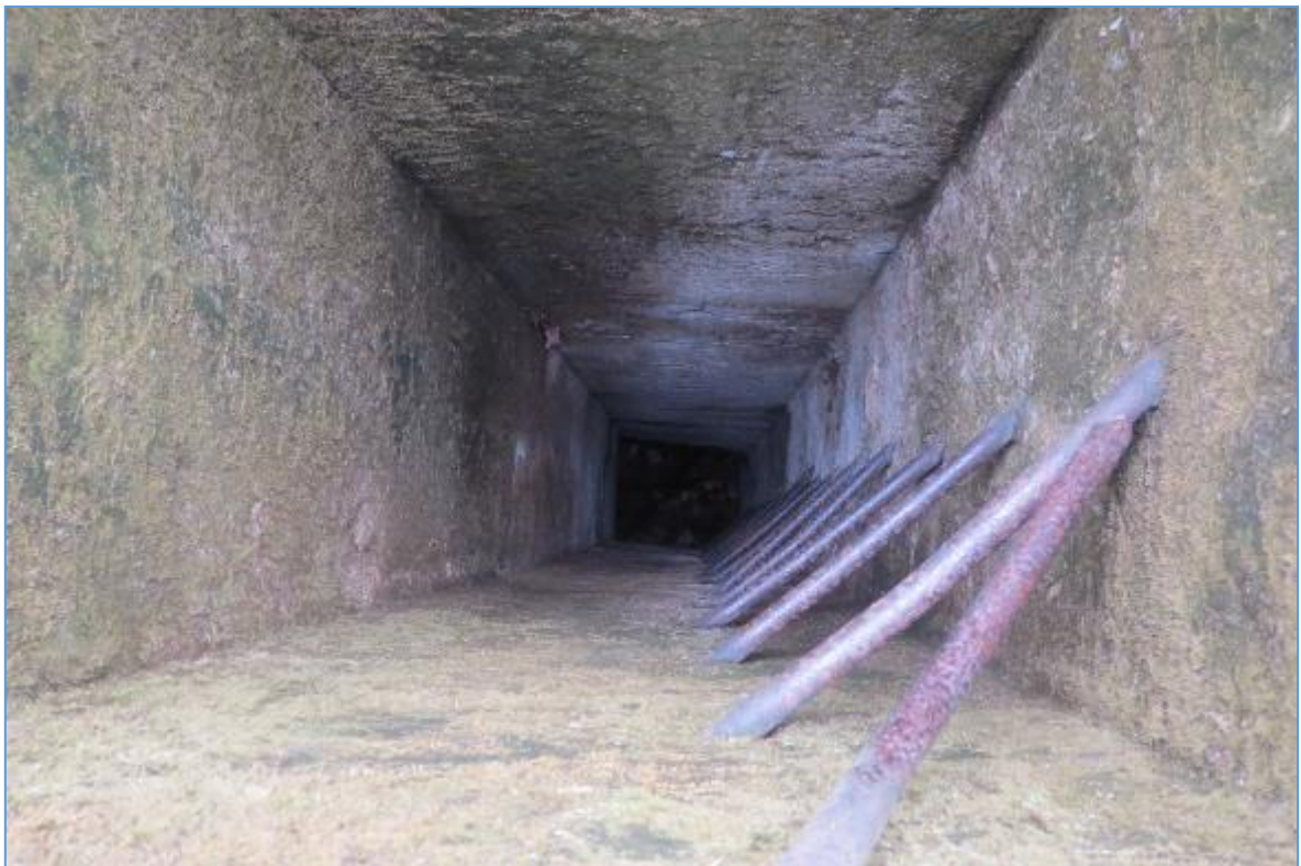
Detail vnútra núdzového výlezu kaverny č.01 v lokalite Ahoj.