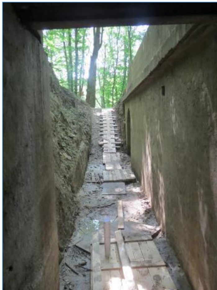
Detail prístupovej chodby do najväčšej kaverny č.1 v lokalite Železná studnička – Klepáč.