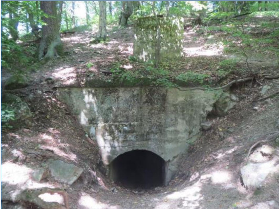
Vstup do malej kaverny č.2 v lokalite Železná studnička – Klepáč