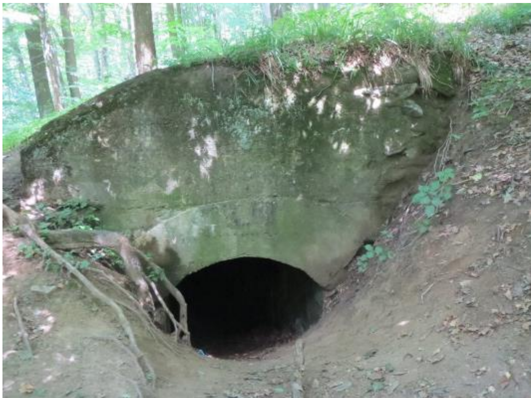
Vstup do malej kaverny č.3 v lokalite Železná studnička – Klepáč