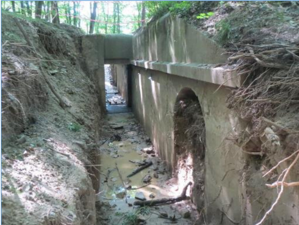
Vyčistený vstup do najväčšej kaverny č.1 v lokalite Železná studnička – Klepáč.