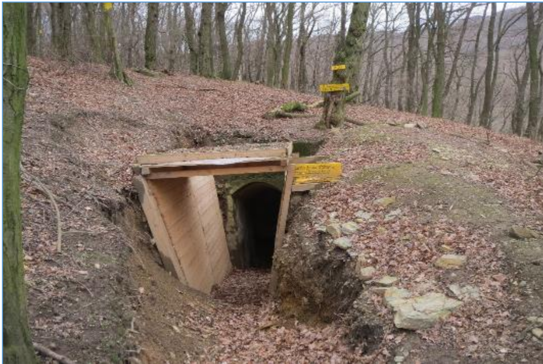
Kaverna č.4 v Důbravke – vstup s novodobou výdrevou.