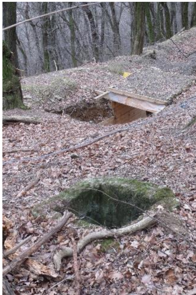
Kaverna č.4 v Důbravke – detail nůdzového východu.