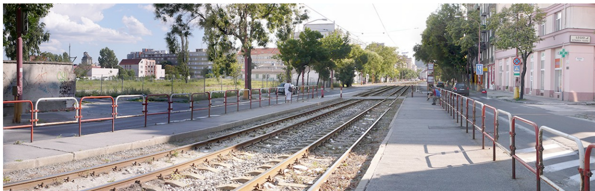
Stav v roku 2009 po demolácii (vľavo)