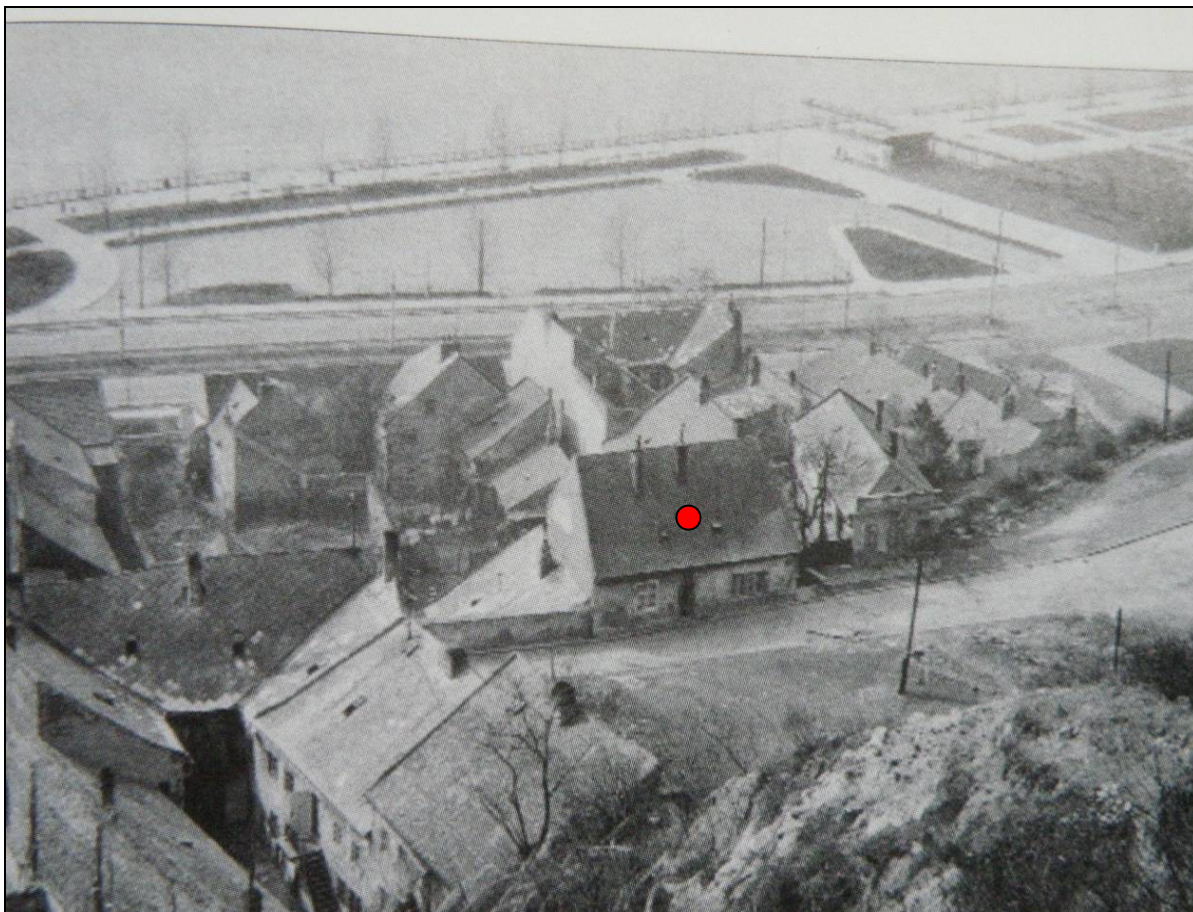
Messerschmidtov dom (označený bodkou) v období 1.republiky.