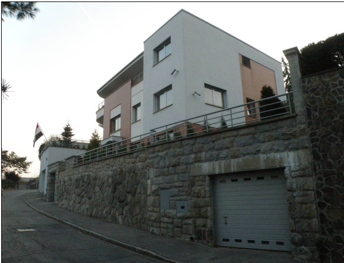
Stav domu po prestavbe začiatkom 21.storočia.