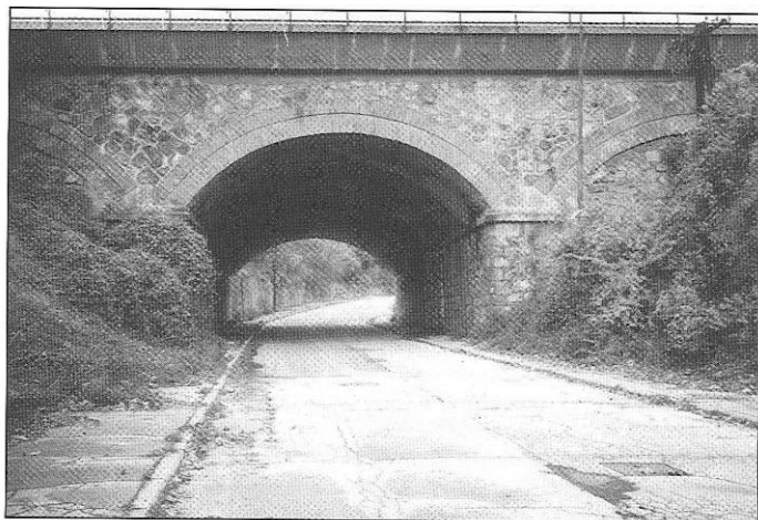
Viadukt nad Sliačskou cestou