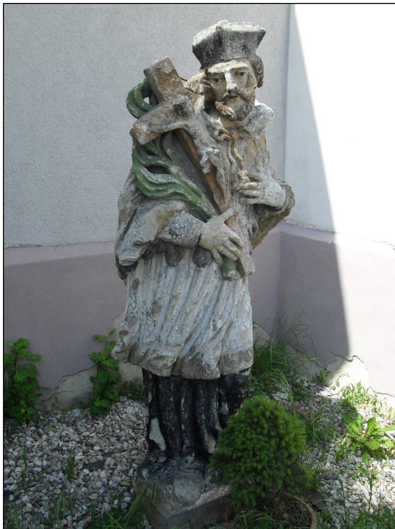
Stav v roku 2010

Mesto: Bratislava Mestská časť: Bratislava – Rača Adresa: Alstrova ulica č.121 Adresa popisom: vo dvore farského úradu Typ pamätihodnosti: kategória 1A – hmotné nehnuteľné Názov pamätihodnosti: socha sv. Jána Nepomuckého Číslo v zoznam MČ: RAC-1A-38 Foto: