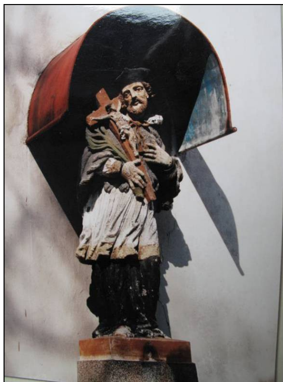
90. roky 20. storočia