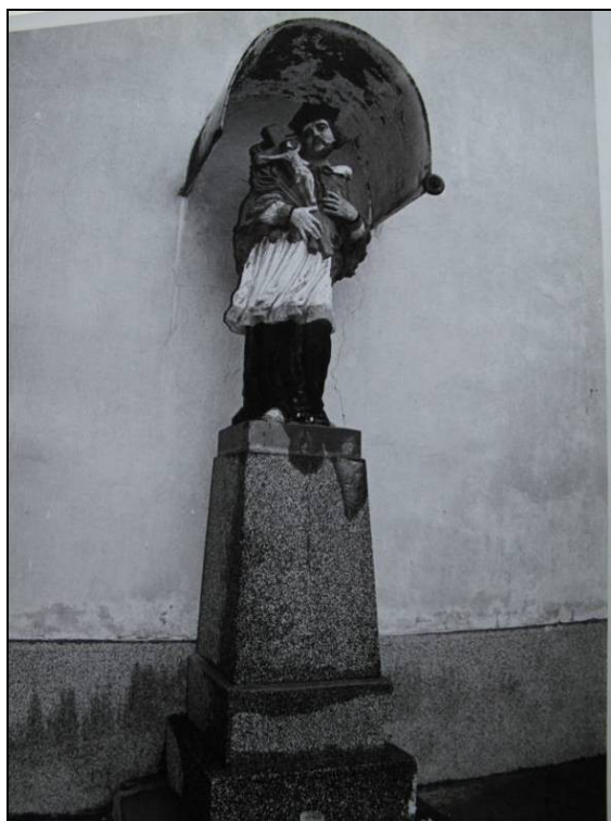
80. roky 20. storočia