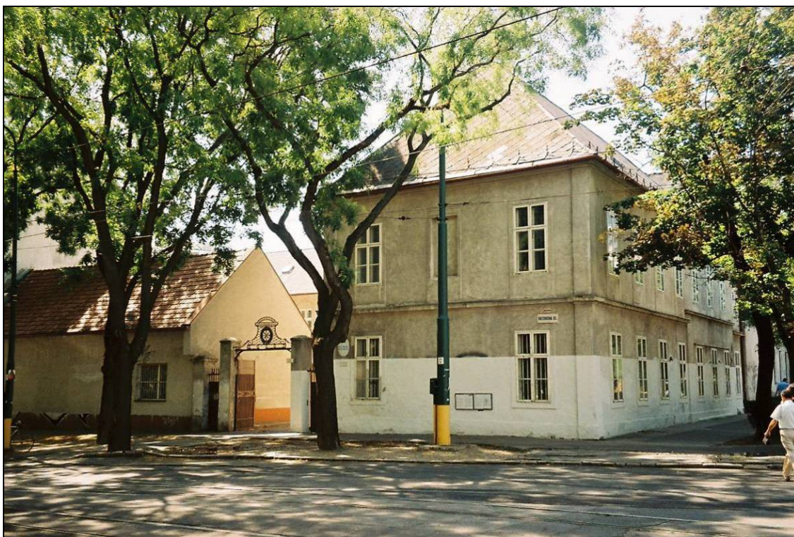
Pohľad z Vazovovej ul.

Mesto: Bratislava Mestská časť: Staré Mesto Adresa: Vazovova 8 Adresa popisom: roh Vazovovej a Radlinského ulice Typ pamätihodnosti: kategória 3 – zaniknutá (funkcia) kategória 1.A – nehnuteľná (hmotná substancia) Názov pamätihodnosti: druhý blumentálsky kostol Č. v zozname MČ: zoznam nie je t.č. vypracovaný Foto: