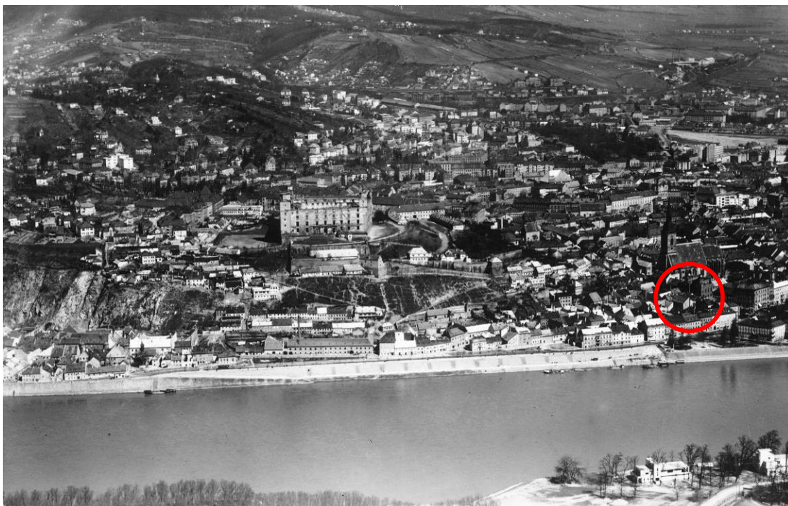
letecký pohľad na hrad a okolie, r. 1930