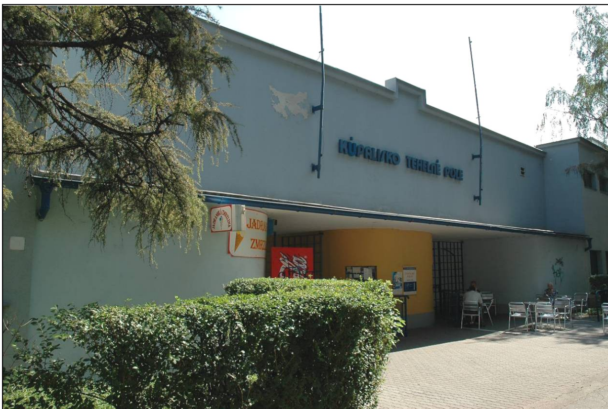
Stav v roku 2011