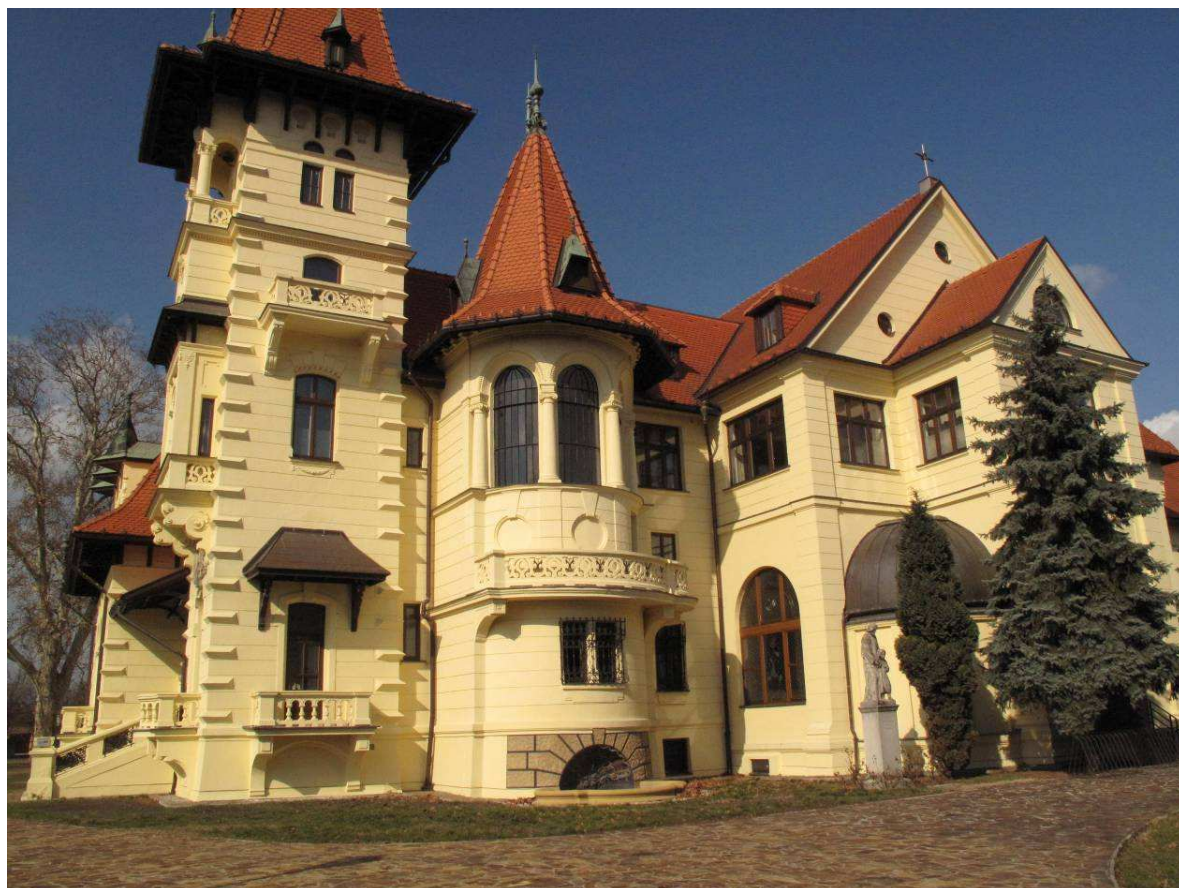
Kaštieľ v Prievoze