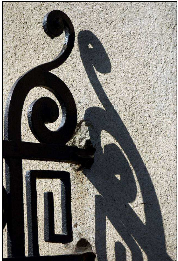
Detail kovovej mreže