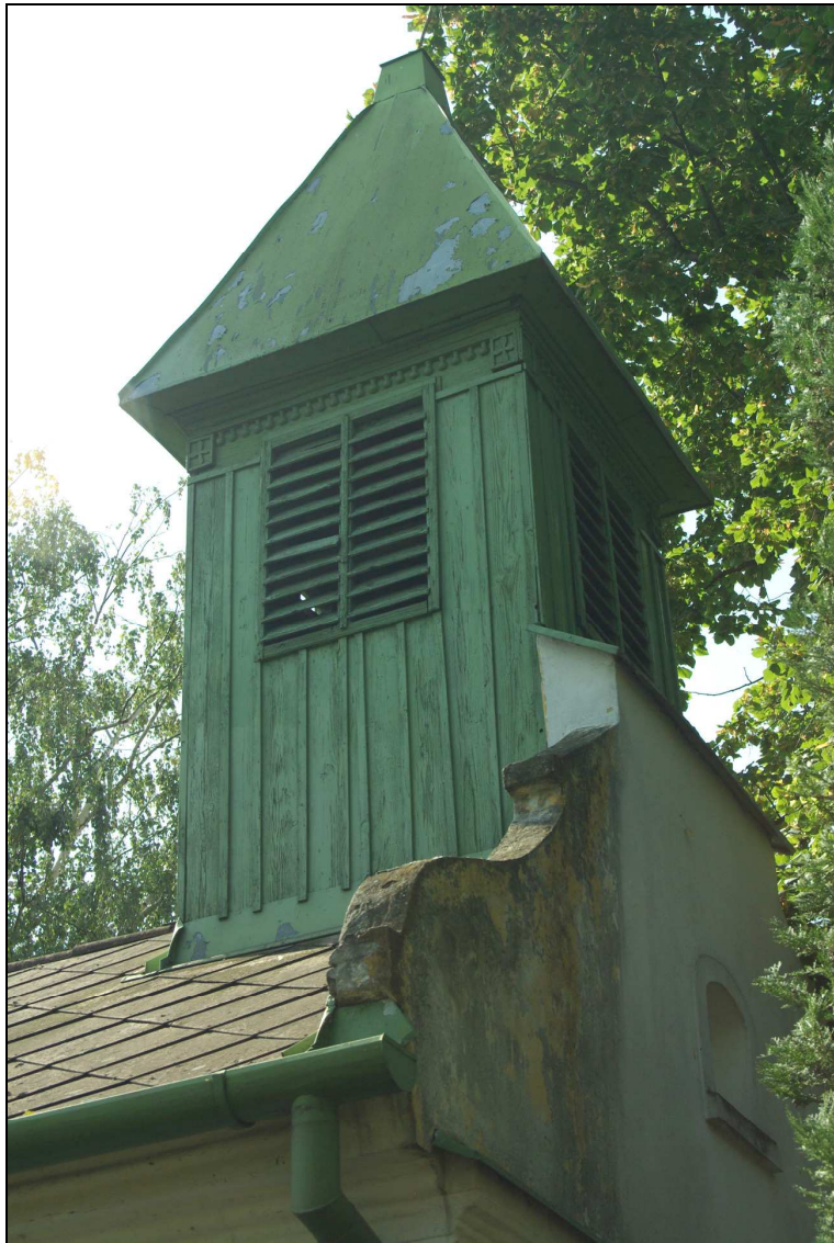
pohľad na vežu kaplnky