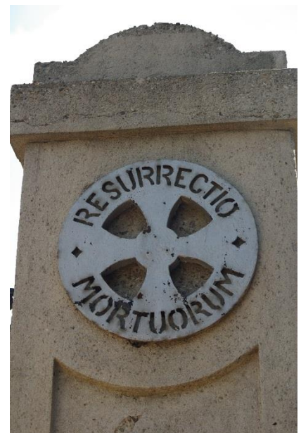
Detail kovovej mreže